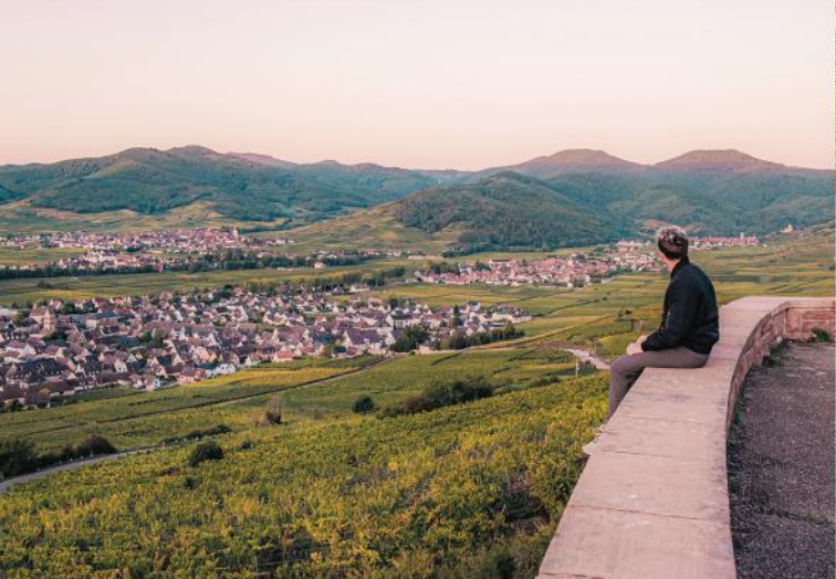
Vue depuis la Nécropole Nationale

C5 Nécropole Nationale à Sigolsheim (Circuits 15 17 19 )