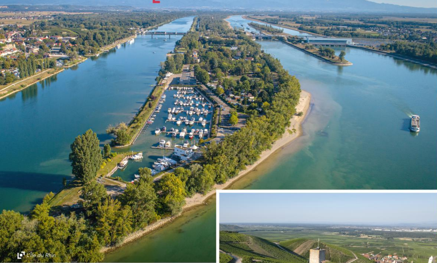
L'île du Rhin

B5 Colline du Mandelberg (ou Colline des Amandiers) à Mittelwihr (Circuits 8 10 )