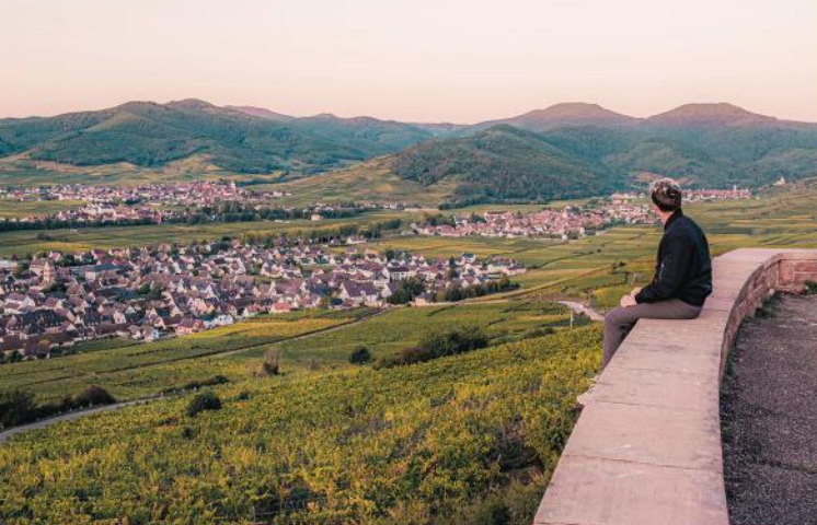
Aussicht von der Nekropole Nationale