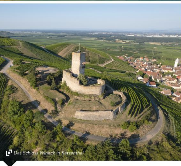
Das Schloss Wineck in Katzenthal