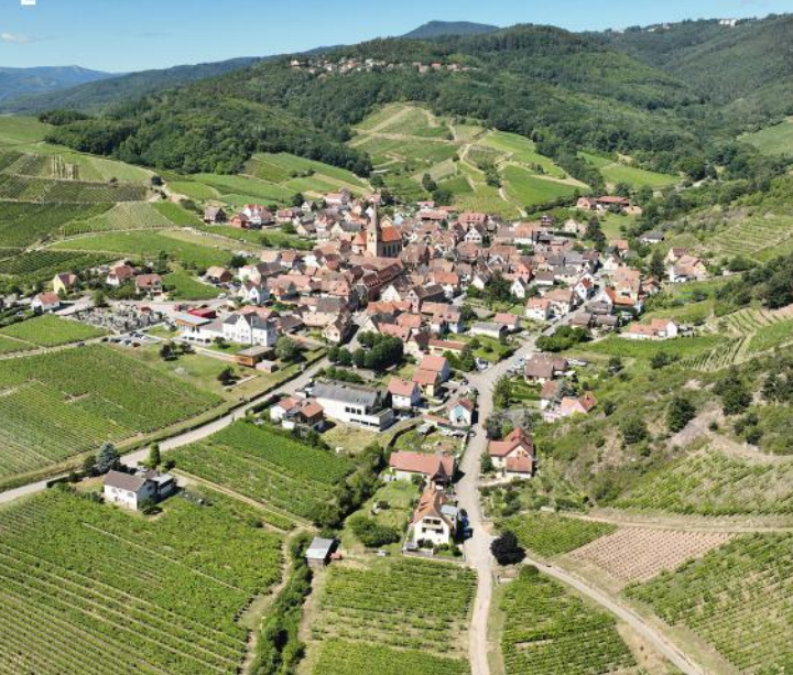
Aussicht auf Niedermorschwihr