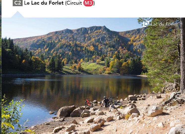
C2 Le Lac du Forlet (Circuit M3)