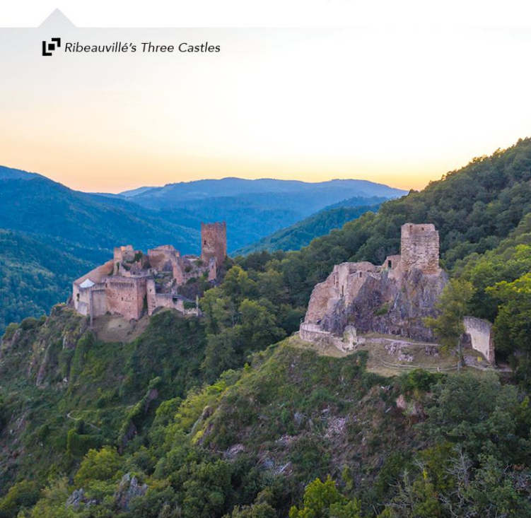
B5 Ribeauvillé's Three Castles (Circuits 5 6)