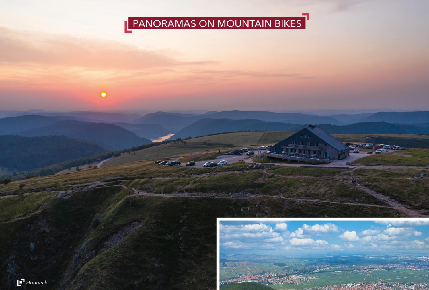
D2 The Hohneck (Circuit M4)