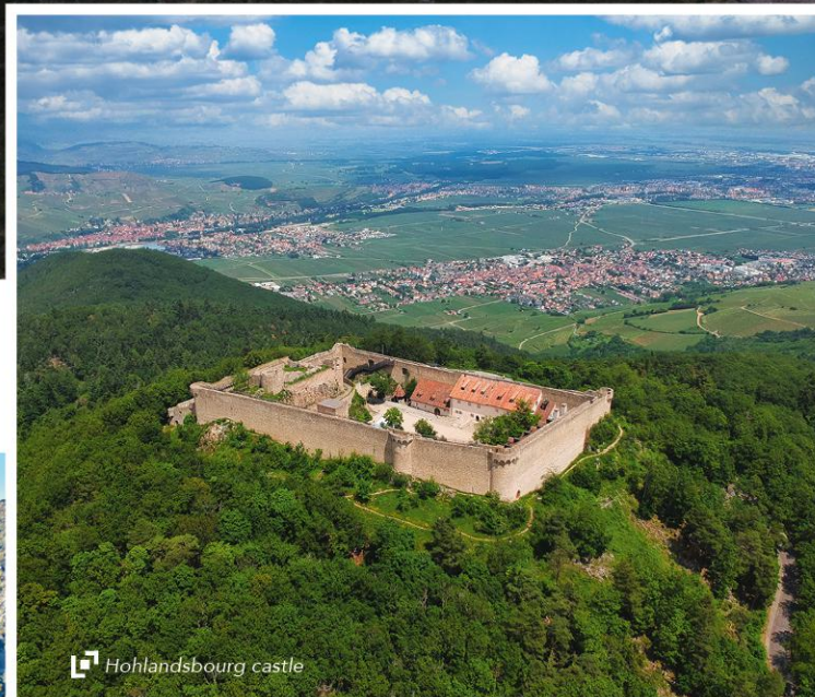
D5 Hohlandsbourg castle (Circuit 1)

From Wissenbourg to Thann With over 400 km length, this signposted itinerary allows you to discover the wealth of the Vosges Mountains. A variety of landscapes, punctuated by unspoilt mountain lakes and breathtaking panoramas... And don't forget the comfort of a break in a farmhouse inn, a true institution in this mid-mountain range.