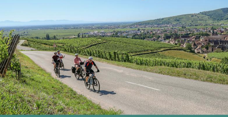
Vineyards near Turckheim

Close to the famous Alsace Wine Road, the Alsace Wine Road Cycle Route runs quietly along the mountainside. Borrowing portions of the ancient Roman road, it winds its way through vineyards and picture-postcard landscapes: picturesque flower-filled towns, remains of medieval castles surrounded by famous vineyards, welcoming winstubs (traditional restaurants)... All along the way, it's a pleasure to stroll through the villages. From Saint Hippolyte in the north to Westhalten in the south, meet the winemakers and their vintage wines!